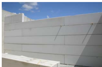
Het vorderen van de werken