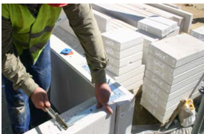
Plaatsing hoekprofiel ter stabilisatie van de hoek