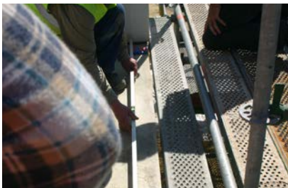
De stelplaatjes worden op de juiste plaats gelegd