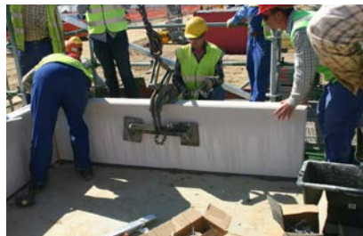
Plaatsing van de wandplaat op de stelplaatjes