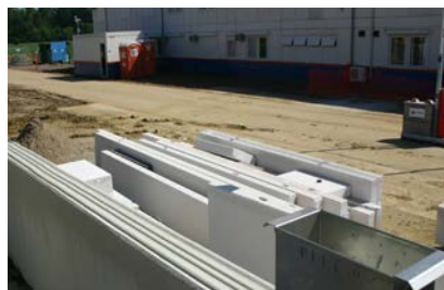
Snel correct aanbrengen van de lijm met een lijmbak