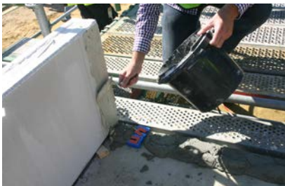
Verlijming van de verticale voegen tussen de platen